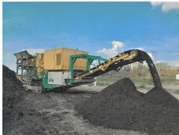
Сл. 1. Мобилна ударна дробилица у време прегледа