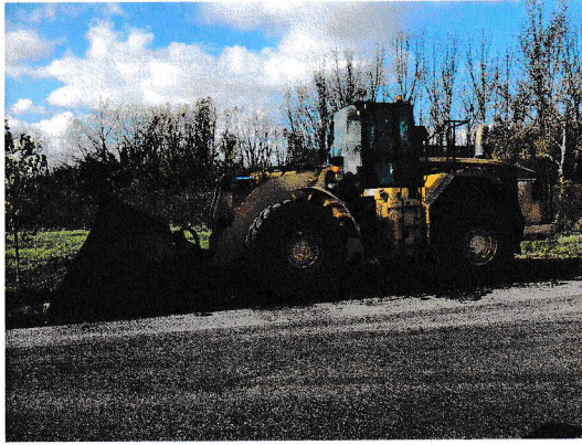
Сл. 1. Утоваривач у време прегледа и провере

Локација: Термоелектрана "Никола Тесла" А, Обреновац