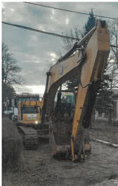
Сл.1. - Хидраулични багер у време прегледа

Локација: Савића Млин 6, 11400 Младеновац